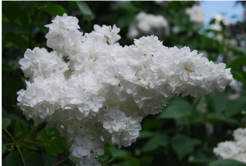
Lilac 'Monique Lemoine' 1939