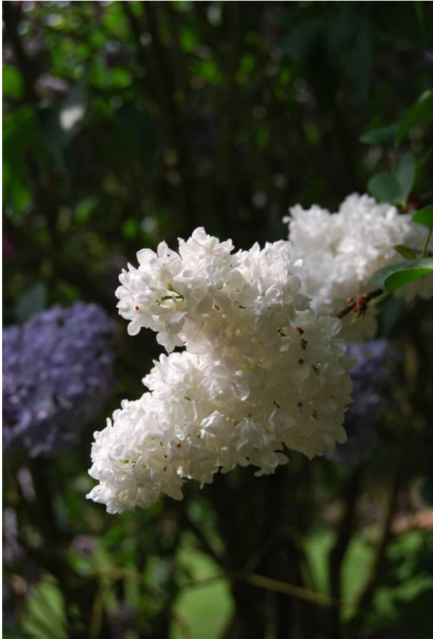
Lilac 'Madame Lemoine' 1890